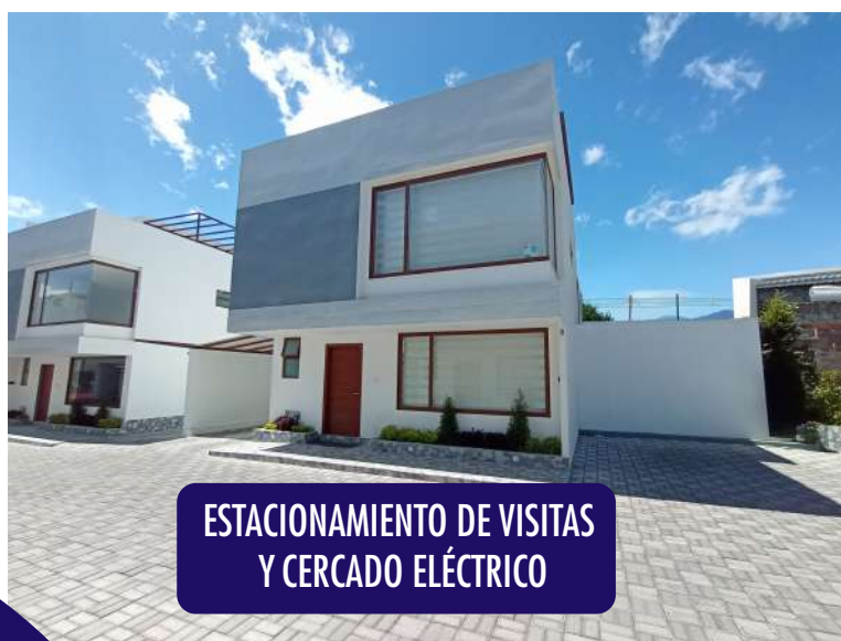
ESTACIONAMIENTO DE VISITAS Y CERCADO ELÉCTRICO