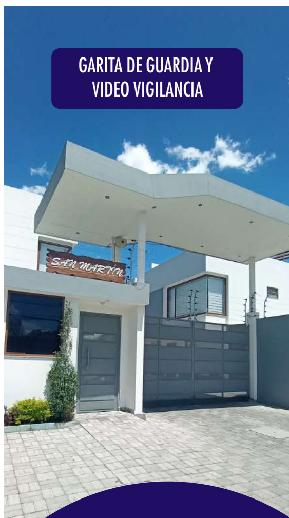
GARITA DE GUARDIA Y VIDEO VIGILANCIA